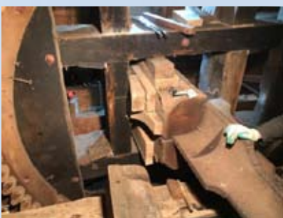
FOTO 1: HET BOVENWIEL IS HIER AL VERSTEVIGD TUSSEN DE KRUISARMEN, EEN VULSTUK IS UITGENOMEN OM OP TE SCHAVEN.

HET OUDE BOVENWIEL BEHOEFTE HERSTELWERKZAAMHEDEN. DOOR JARENLANG FUNCTIONEREN ZAT HET NIET VOLDOENDE STERK IN ELKAAR EN ZAT ER SPELING OP CRUCIALE VERBINDINGEN. OM ZO VEEL MOGELIJK VERVANGING TE VOORKOMEN IS HET BOVENWIEL UITVOERIG VERSTERKT EN IS SPELING OPGEVULD.